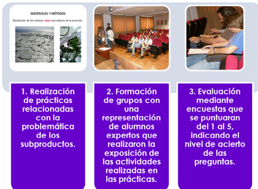
Figura 1. Actividades desarrolladas en el proyecto